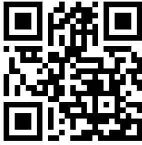
สแกนดาวน์โหลดโปรแกรม Zoom