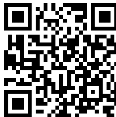
สแกนเข้าห้องประชุมผ่าน Zoom ID ๙๑๒ ๔๐๖๔ ๔๒๗๐

สอบถามข้อมูลเพิ่มเติมได้ที่ผู้ประสานงานโครงการ