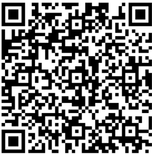
สแกนส่งแบบตอบรับการประชุม

ณ อาคารวิทยุทอง หมู่ที่ 4 ตำบลท่าช้าง อำเภอบางกล่ำ จังหวัดสงขลา